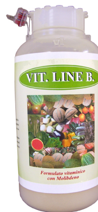
FORMULATO VITAMINICO CON MOLIBDENO

MODALITA' D'IMPIEGO TRATTAMENTO FOGLIARE